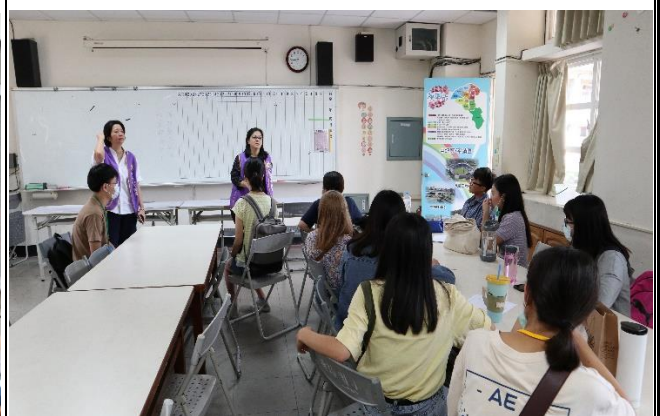
上完課後，教授進行議課